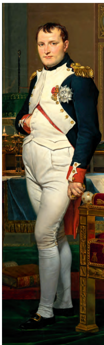
Die Hand unter der Weste: Vielleicht liegt es an dieser berühmten Pose, dass so manche Stomaträger glauben, Napoleon sei selbst auch ein Stomaträger gewesen.

Amussat berichtete über genau 29 Patienten, die seit 1776 operativ ein Stoma erhalten hatten. Nur neun von ihnen hatten den chirurgischen Eingriff überlebt, es waren fünf Kinder und vier Erwachsene. Alle anderen waren kurze Zeit nach ihrer Operation infolge einer Bauchfellentzündung verstorben. Vergeblich versuchte Amussat, die Operationstechnik